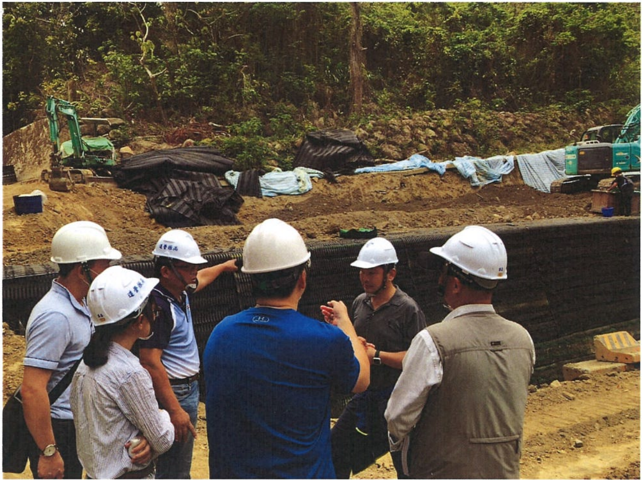
配合委辦團隊辦理邊坡監測及穩定分析現勘