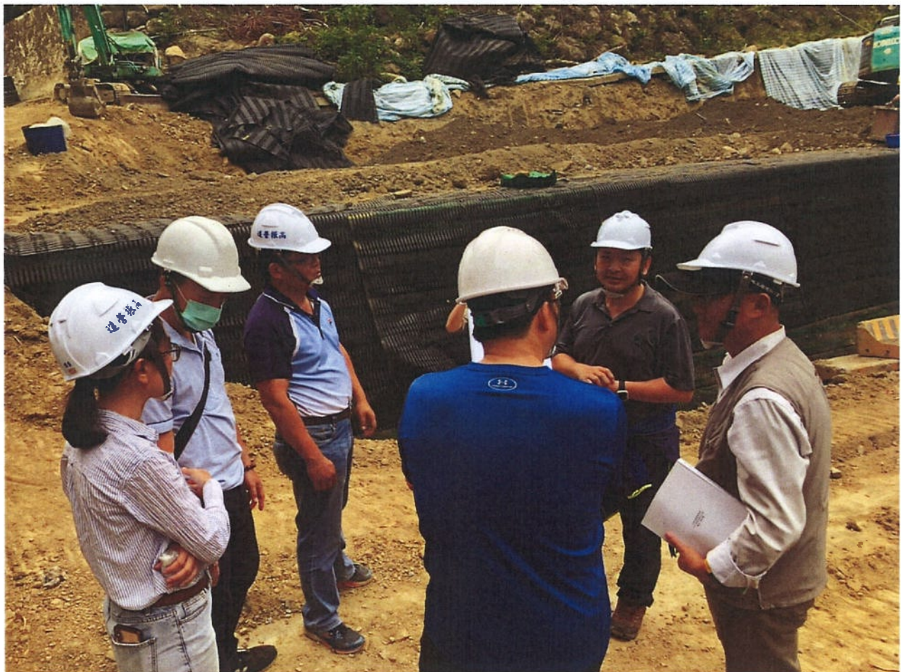
配合委辦團隊辦理邊坡監測及穩定分析現勘